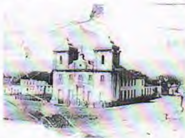
Igreja Matriz da Freguesia de Senhora Santana de Caetité – séc. XIX

Ainda na primeira metade do século XVIII, famílias do Arraial construíram uma capela em devoção à Senhora Sant'Ana, tradição herdada dos portugueses, além disso, essas mesmas famílias doam terras para a nova freguesia desmembrada da Matriz de Nossa Senhora de Rio de Contas, em 1754.